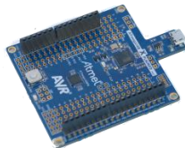
소켓 부착 X-Mini (인강 실습교재용)